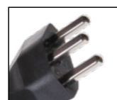
Typ23 angespritzt Type23 moulée